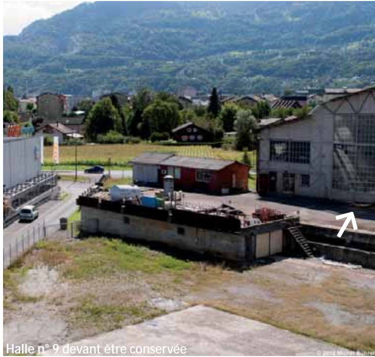
Halle n° 9 devant être conservée