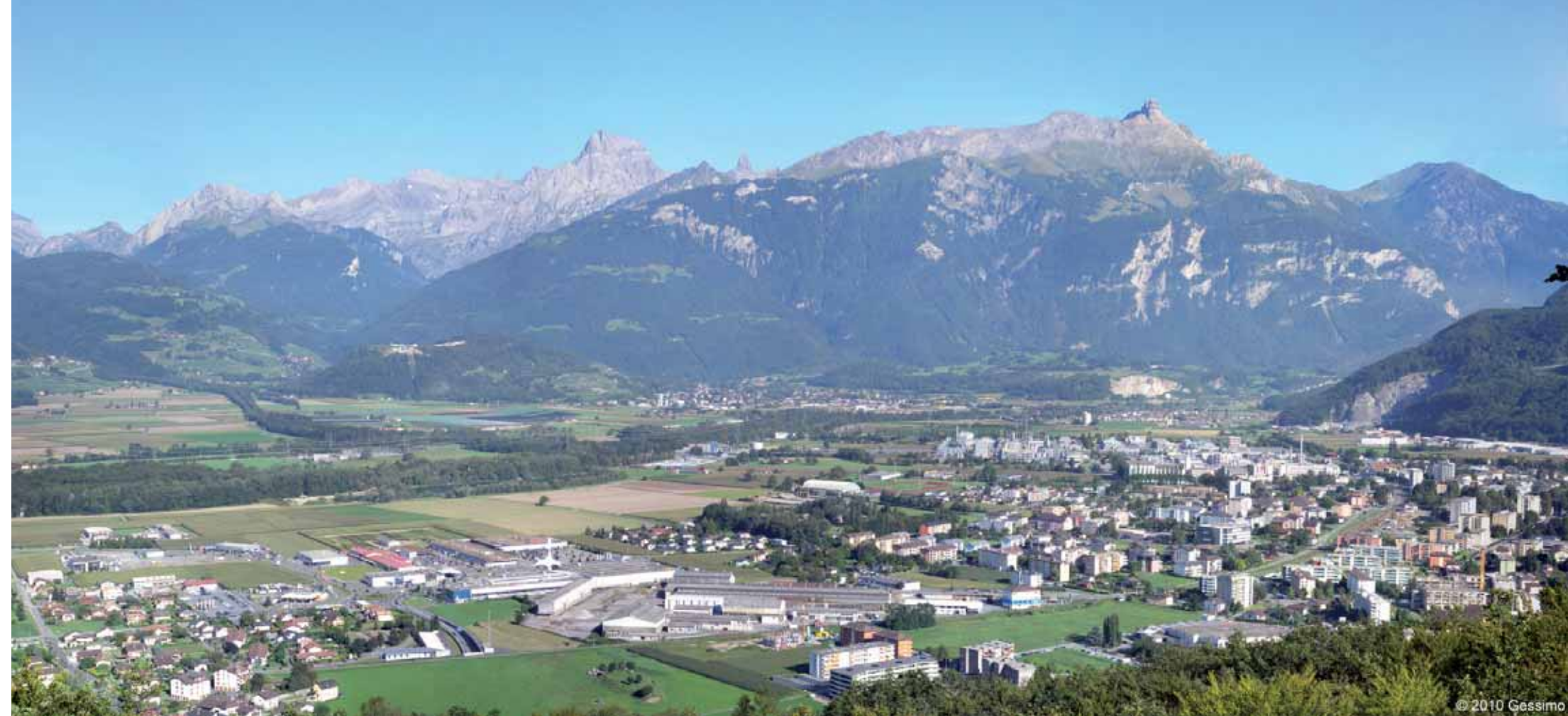
Prise de vue semi-aérienne du site