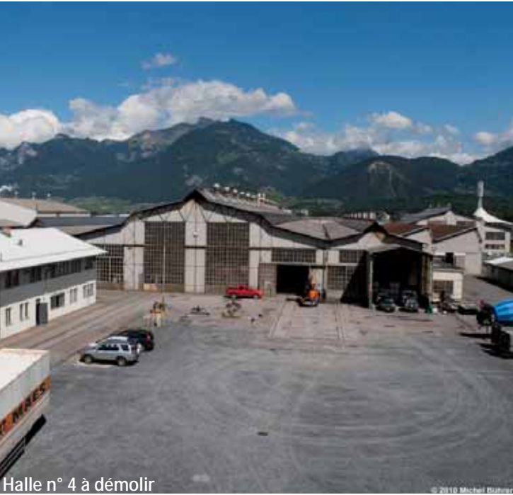
Halle n° 4 à démolir