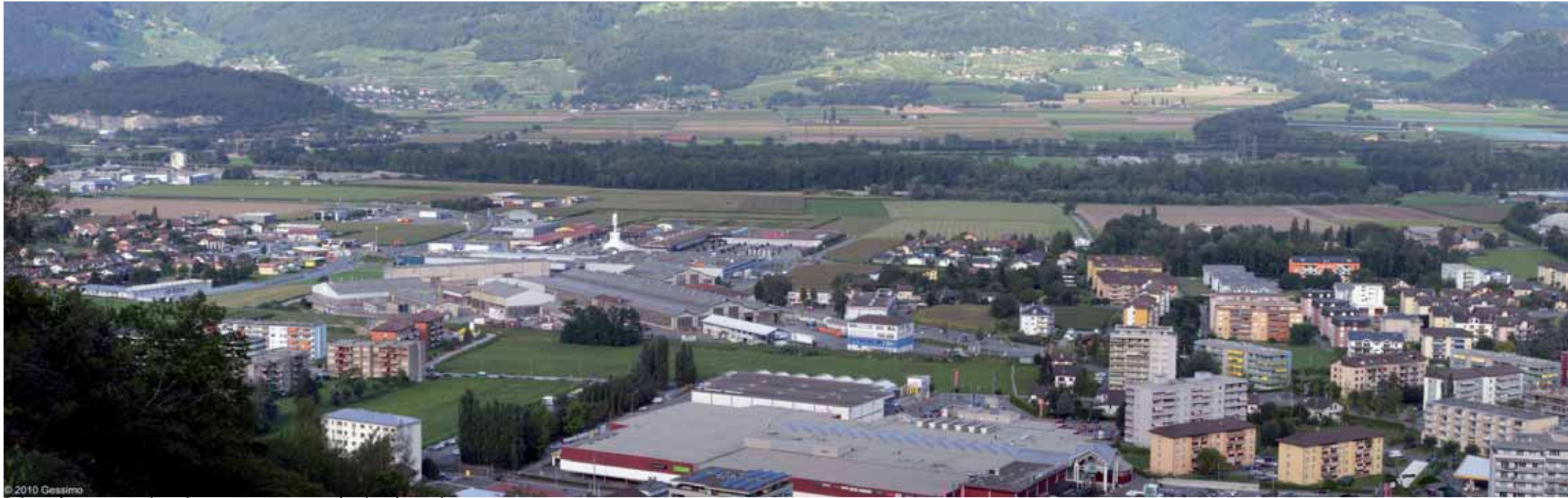
Prises de vues semi-aériennes sans et avec le site de projet