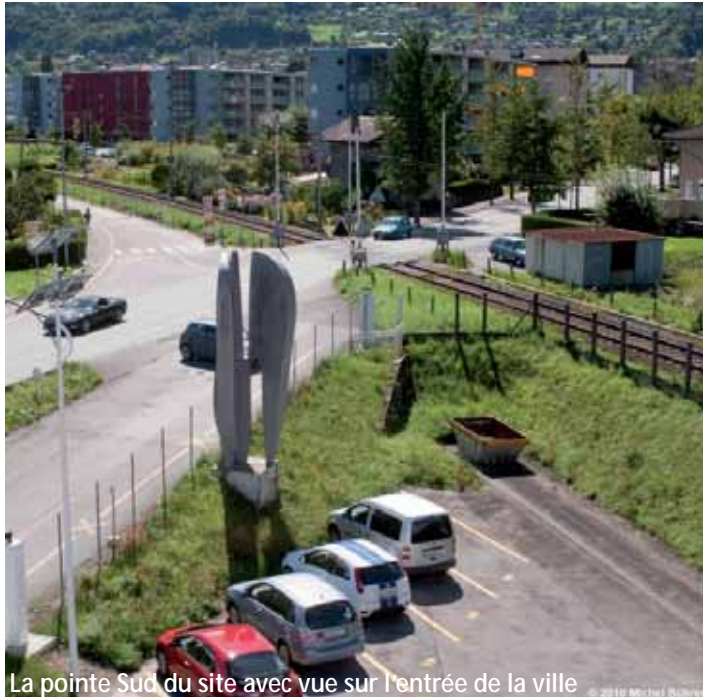
La pointe Sud du site avec vue sur l'entrée de la ville