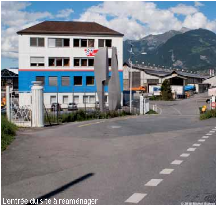
L'entrée du site à réaménager