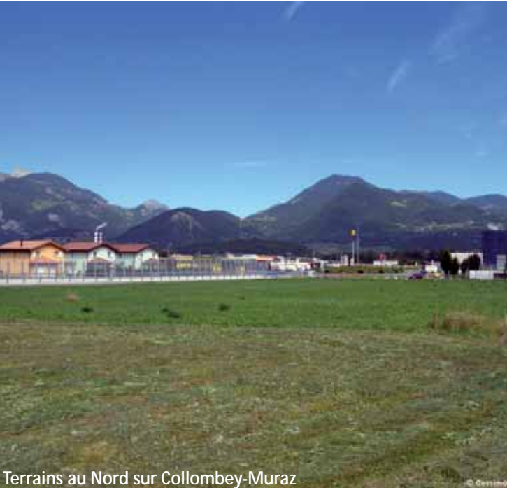
Terrains au Nord sur Collombey-Muraz