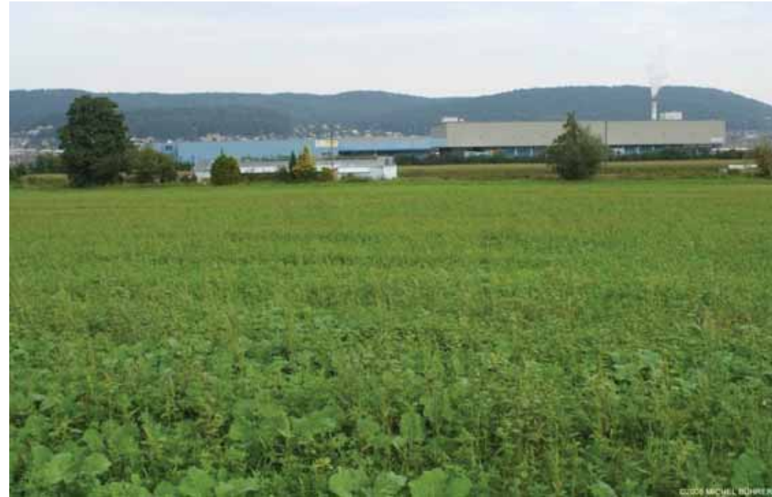
En voisinage de la plateforme multimodale