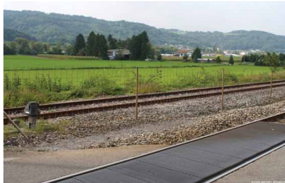
La voie de chemin de fer au bord du périmètre