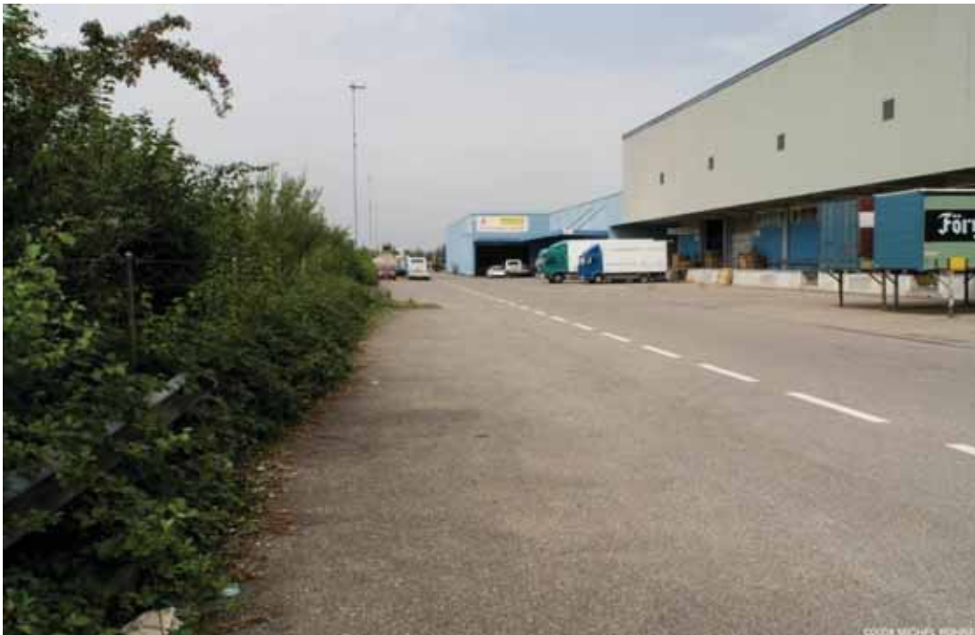
Le quai routier attenant à la plateforme multimodale