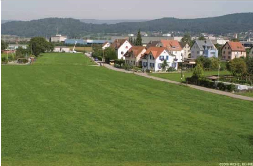
Le rapport à la ville périphérique