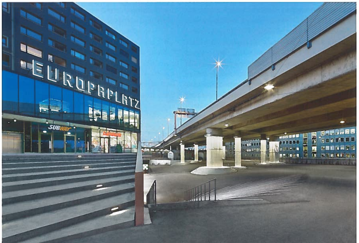
1 Blick Richtung Bahnhof Europaplatz. Vue vers la gare Europaplatz.

Ausserholligen se situe entre Berne et Bümpliz. L'ancienne route nationale vers Fribourg passe ici tout près, de même que la ligne ferroviaire depuis 1860. La construction du tronçon ferroviaire vers Neuchâtel d'où bifurque la voie dans la vallée de la Gürbe et vers Schwarzenburg (Gürbetal-Bern-Schwarzenburg GBS), date de 1901. Celui-ci passe sous le tronçon de Lausanne et la Freiburgstrasse. Dans les années 1970, l'autoroute A12 a franchi le tout avec un imposant pont autoroutier. Le classement en 1989 d'Ausserholligen comme pôle de développement cantonal a représenté l'impulsion décisive en faveur du développement urbain. Le résultat est la création des gares CFF et GBS