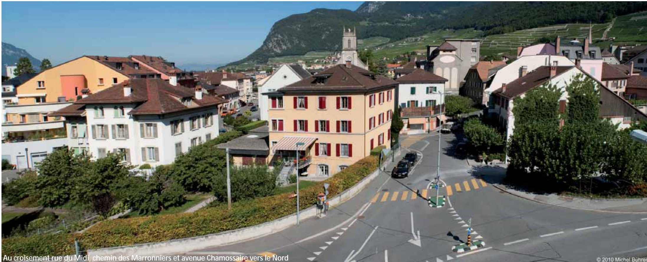
Au croisement rue du Midi, chemin des Marronniers et avenue Chamossaire vers le Nord