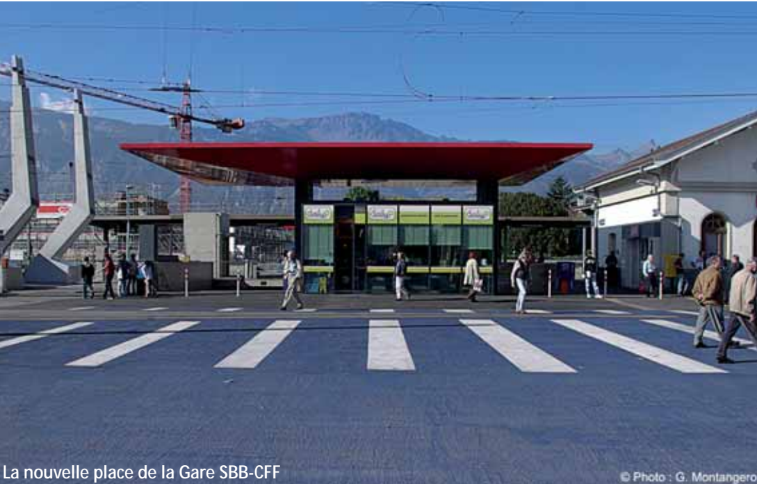
La nouvelle place de la Gare SBB-CFF