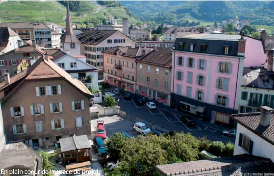
En plein coeur de l'espace de projet