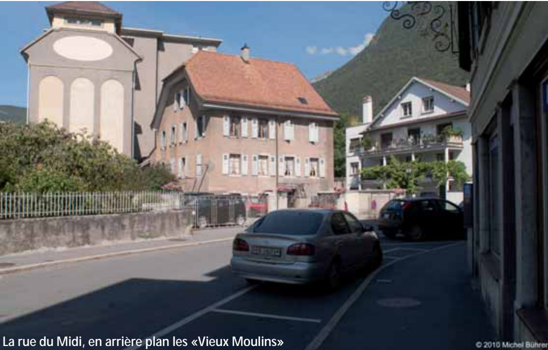
La rue du Midi, en arrière plan les «Vieux Moulins»