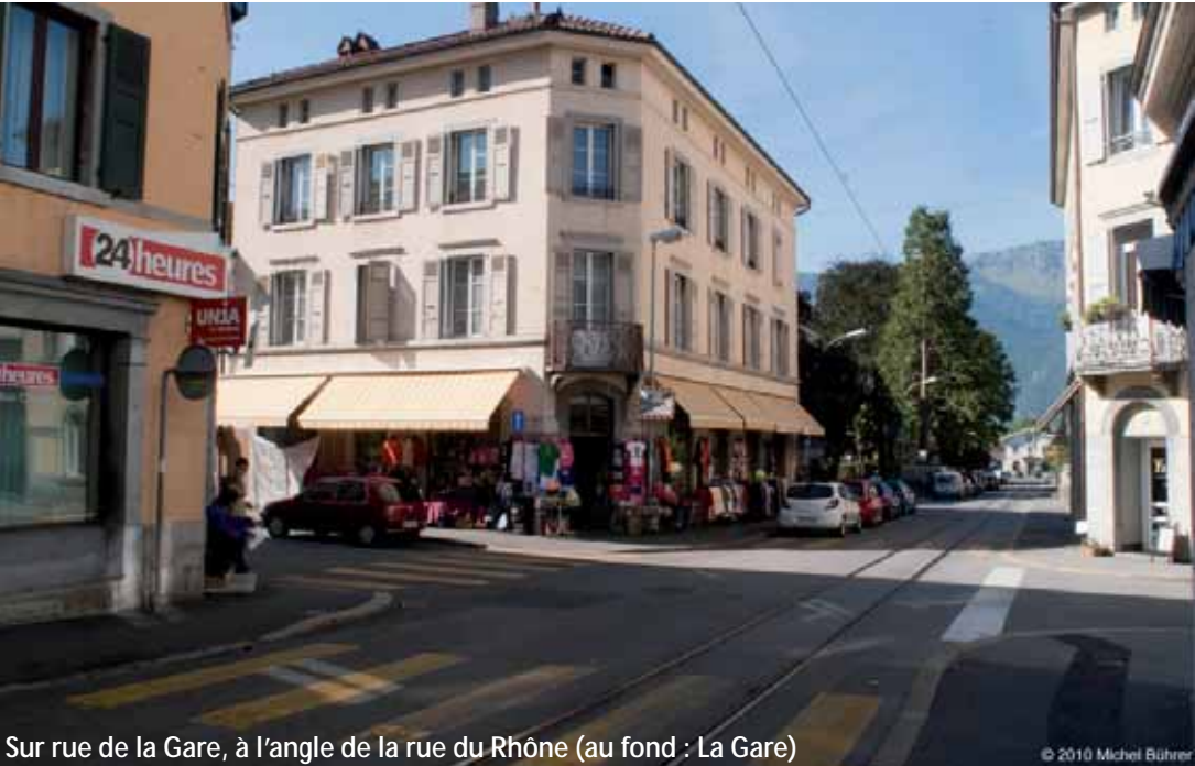
Sur rue de la Gare, à l'angle de la rue du Rhône (au fond : La Gare)