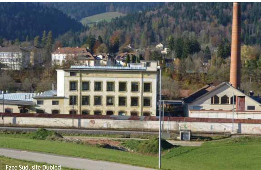
Face Sud, site Dubied