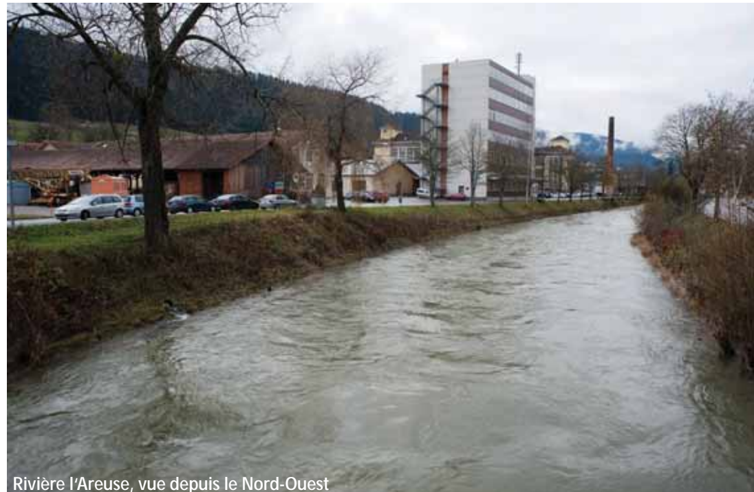
Rivière l'Areuse, vue depuis le Nord-Ouest