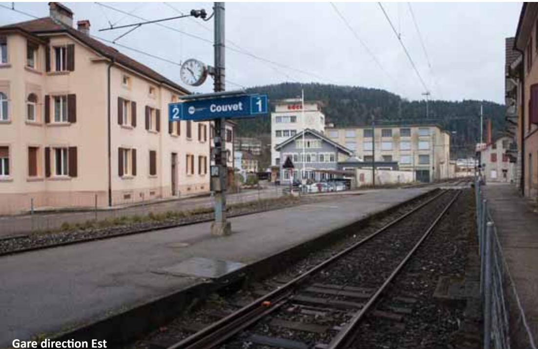
Gare direction Est