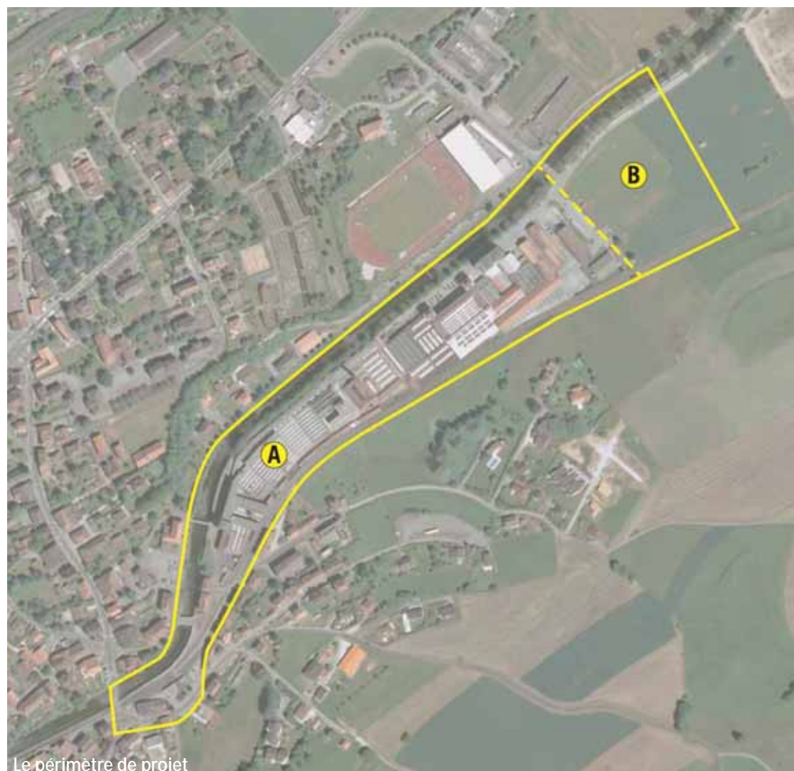
Photo aérienne avec éléments stratégiques