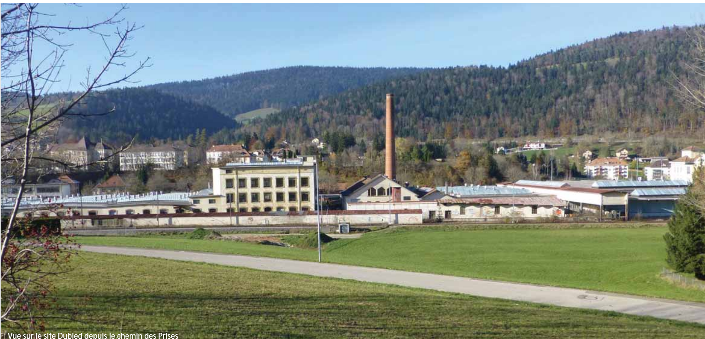
Vue sur le site Dubied depuis le chemin des Prises

CATEGORIE Industrielle/paysagère/architecturale REPRESENTANT DE L'EQUIPE Architecte-urbaniste-paysagiste SITUATION Couvet (NE) - Dubied-Site, de part et d'autre de l'Areuse POPULATION 2'760 habitants pour le village de Couvet et 12'000 habitants pour la Commune SITE D'ETUDE 67 ha. SITE DE PROJET 9 ha. SITE PROPOSE PAR Commune de Val-de-Travers en partenariat avec l'Etat de Neuchâtel PROPRIETAIRES DU SITE Privés, Commune de Val-de-Travers et Etat de Neuchâtel TYPE DE COMMANDE APRES CONCOURS Mandat de développement des projets du secteur Dubied, de la zone industrielle et du centre du village.