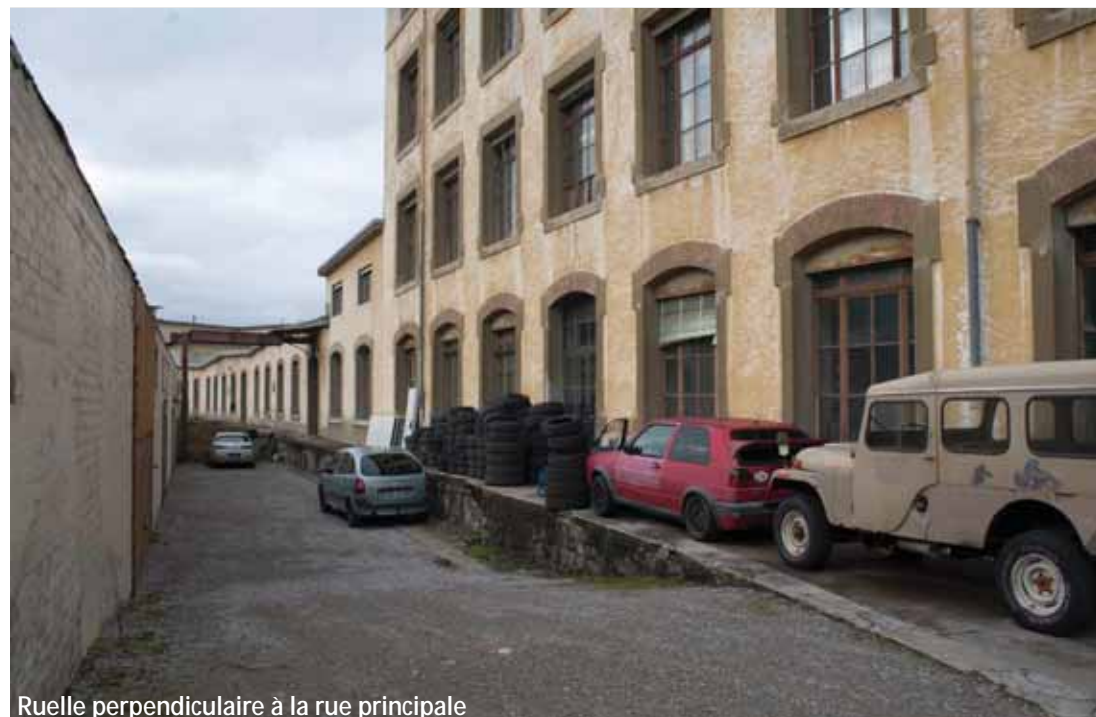
Ruelle perpendiculaire à la rue principale