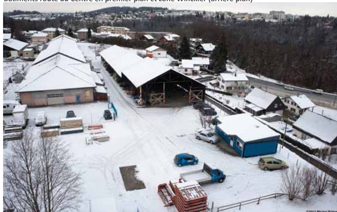
Vue sur l'entreprise Dousse Constructions SA (bâtiment n°48 de la route de Fribourg) depuis le bâtiment n°3 de la route du Nord