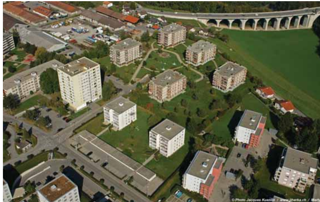
Bâtiments route du Centre en premier plan et zone Winckler (arrière plan)