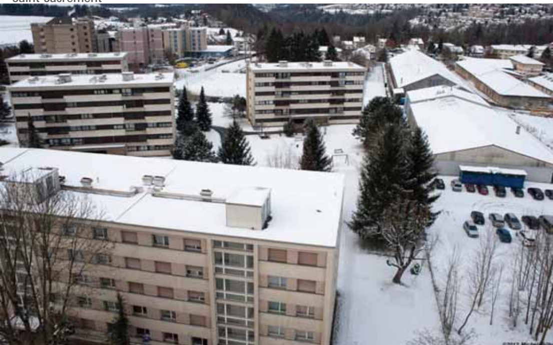
Vue du bâtiment n°50 de la route de Fribourg et du secteur Saint-Sacrement depuis le bâtiment n°33 de la route du Centre