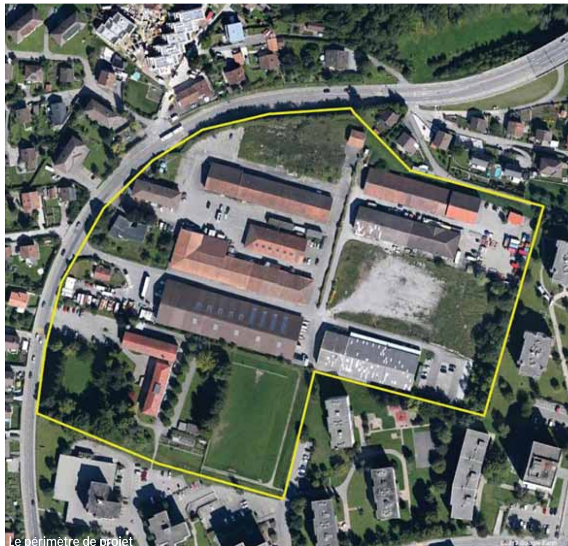
Photo aérienne avec éléments stratégiques